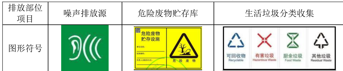
表4-11 各排污口环境保护图形标志一览表

企业应当按照中华人民共和国生态环境部《排污口规范化整治技术要求》设置排污口及环保图形标志牌。本项目涉及的排污口及环境保护图形标志见表4-11。