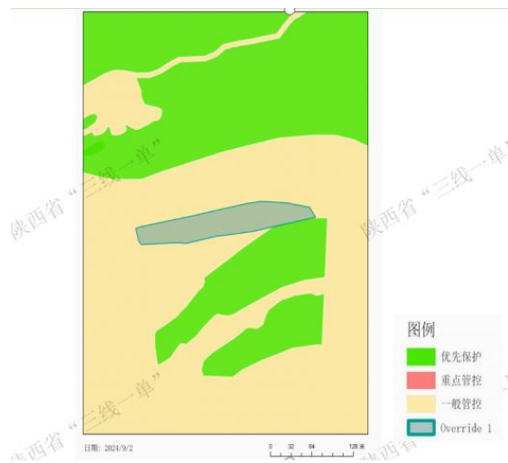
图 1-1 项目区域与旬阳市“三线一单”管控单元对比图

通过陕西省“三线一单”数据应用系统分析比对，本项目属于“陕西省安康市旬阳市一般管控单元1”。项目与旬阳市“三线一单”管控单元比对图见图1-1所示。