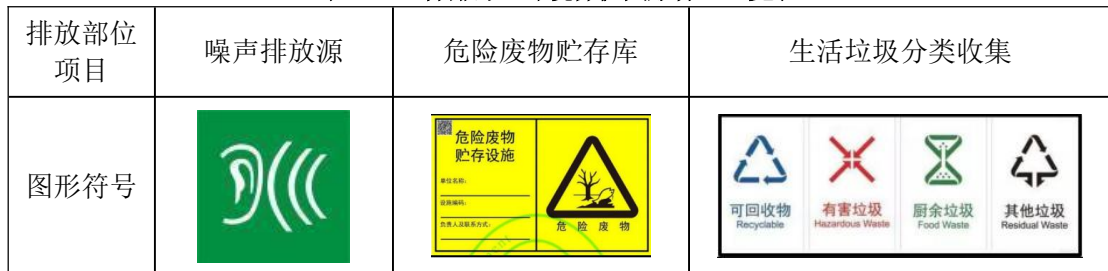
表 4-10 各排污口环境保护图形标志一览表

企业应当按照中华人民共和国生态环境部《排污口规范化整治技术要求》设置排污口及环保图形标志牌。本项目涉及的排污口及环境保护图形标志见表 4-10。